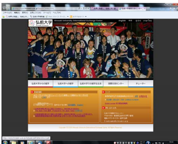
国際交流センター HP トップページ