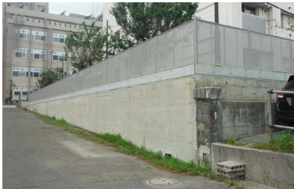
【金属製の塀へ交換】