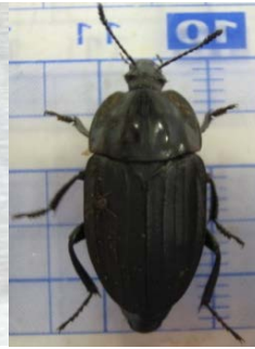
オオヒラタ シテムシ