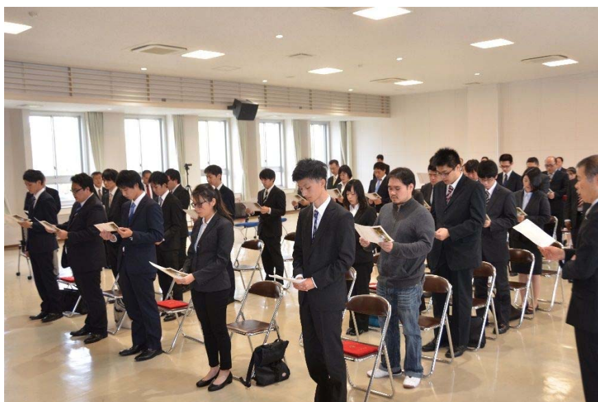
学生歌斉唱の様子