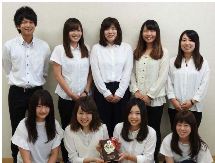
「チーム 弘前大学じゃいご娘」

今後も，本学部は大学生のアイデアをさまざまな形で具現化し，一層の人材育成に取り組んでいきます。