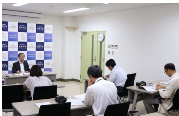
記者会見場の様子