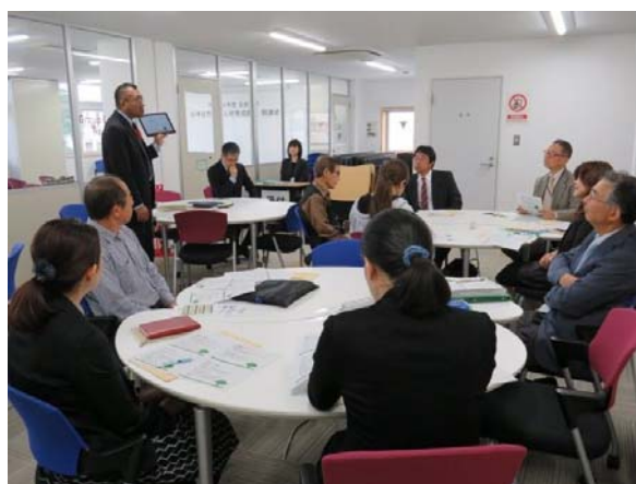
ガイダンスの様子