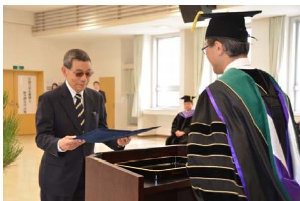
嶋氏への名誉博士称号授与