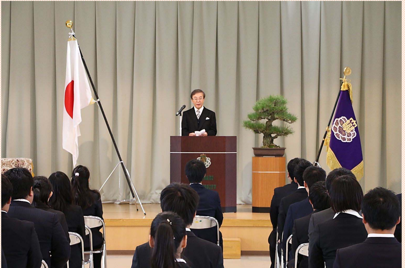
平成28年度秋季学位記授与式