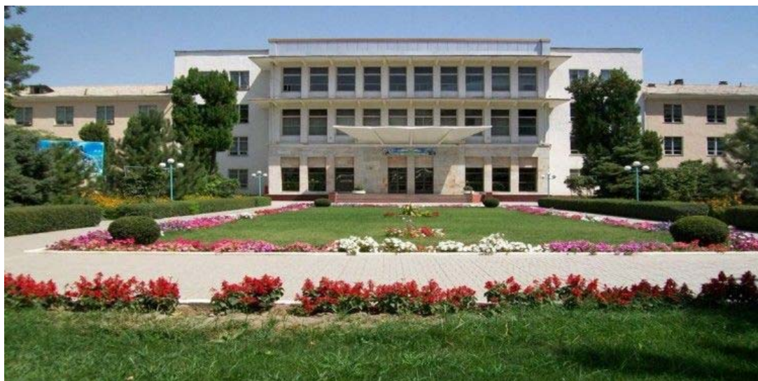
ウズベキスタンのサマルカンド農業学院

なお、本学における大学間交流協定は、平成 28 年 5 月 13 日に締結されたオアハカ州立自治ベニトフアレス大学 (メキシコ) に続いて 28 校目となり、今回のサマルカンド農業学院との協定により、中央アジアとの国際交流の進展が期待されます。