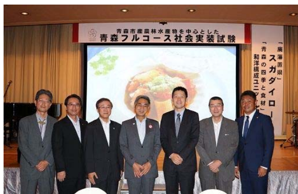
関係者による記念写真

同研究所と同ホテルでは参加者から集めたアンケート結果の分析を進め、料理の価格面や構成などを検討し、「Farm to Table（生産現場から食卓へ）」をキーワードに食材の研究、商品開発に繋げていくとともに、食材の輸送方法、レストラン経営なども含めた「食の総合プロデュース」による地域貢献活動を進めていく予定です。