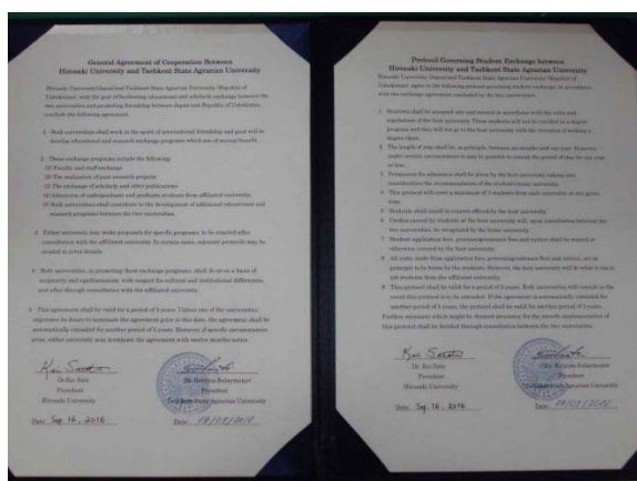
タシュケント州立農科大学との協定書

ウズベキスタンは, 農家の生計向上と国の経済的な発展のために, 近代的な農業技術の導入に力を入れており, 特にリンゴ「ふじ」の栽培が急速に増え, 近代的な栽培技術の教育や研究に対する関心が高いところがあります。近代的な農業技術の導入のために, リンゴ以外にもさまざまな技術への関心が高く, 弘前大学との教育・研究の交流による効果が期待されています。