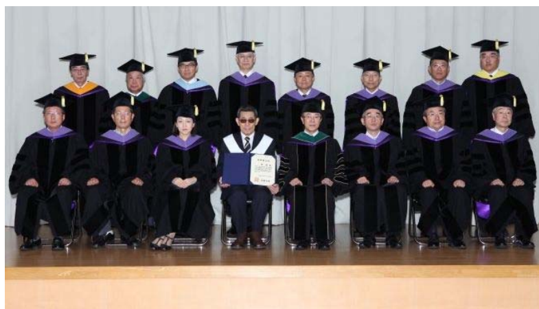
関係者による記念撮影