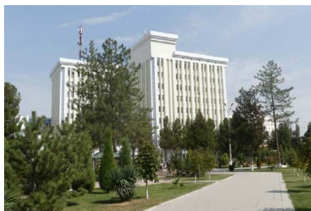
タシュケント州立農科大学キャンパス