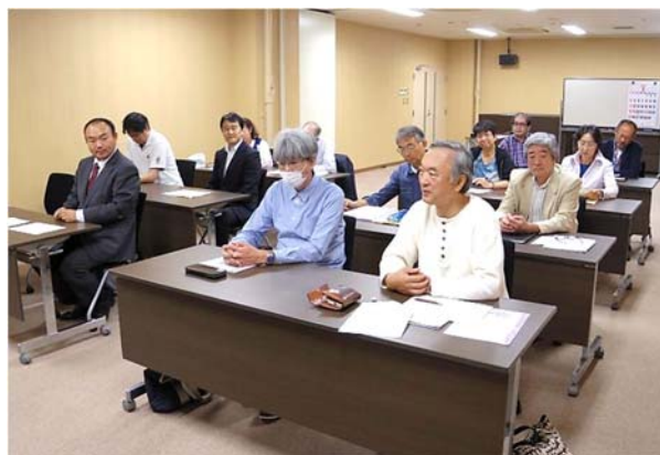
弘前大学グリーンカレッジ生