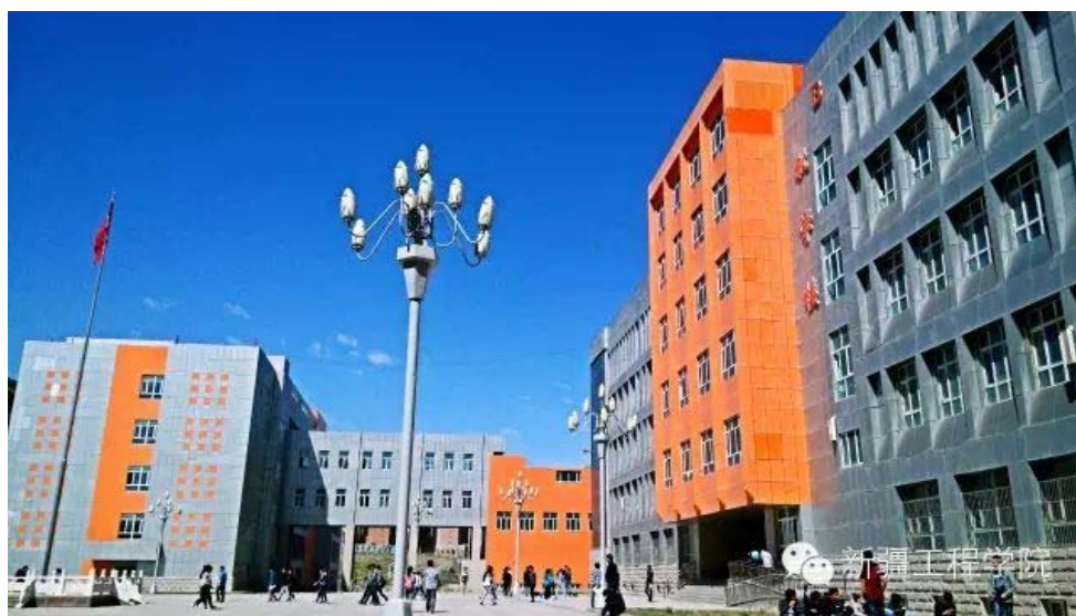
新疆工程学院キャンパス（中華人民共和国）

なお、本学における大学間交流協定は、平成 28 年 9 月 22 日に締結されたサマルカンド農業学院（ウズベキスタン）に続いて 29 校目となります。