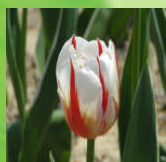
ハッピー ジェネレーション