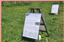
ポスター展示(屋外)