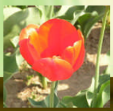
レッド インプレッション