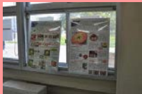
ポスター展示(屋内)

農場の事業概要や教職員による教育研究の成果をポスターで展示します。また、チューリップの簡単な解説及び農場見学ツアーを屋外で随時実施します。