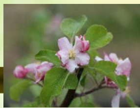
リンゴの花(紅の夢)