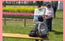
チューリップ屋外解説

※今年は、販売コーナーはございません。 何卒ご了承くださいるよう、お願いいたします。