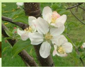
リンゴの花(こうこう)